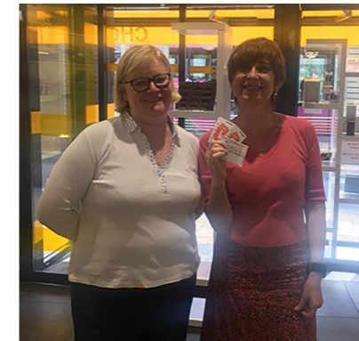
Heureuse gagnante des places de cinéma chez Pâtisserie BISTON.

Le tirage au sort et la remise des prix ont eu lieu dans chaque commerce. Les heureux gagnants ont eu la chance de se voir attribuer 2 places de cinéma ou 2 places pour le concert pique-nique des Flâneries Musicales qui a eu lieu le 21 juillet au parc de Champagne.