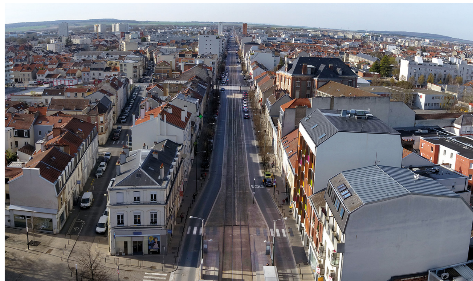
L'avenue de Laon et le quartier du faubourg Laon-Neufchâtel en direction de La Neuville.