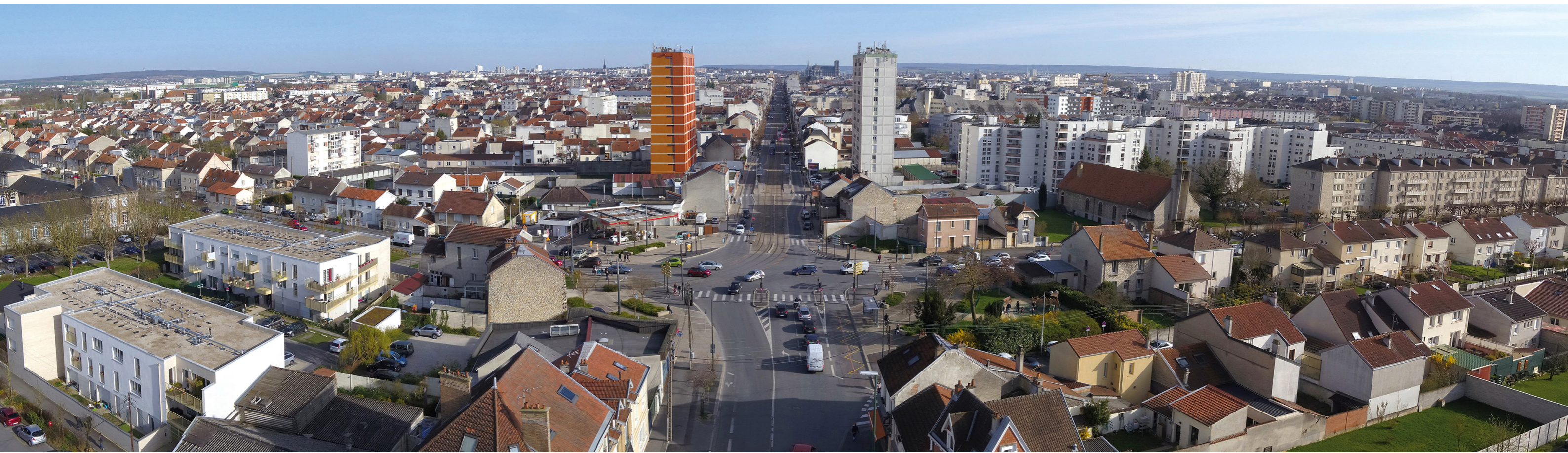
L'avenue de Laon et le quartier du faubourg Laon-Neufchâtel en direction du centre ville.