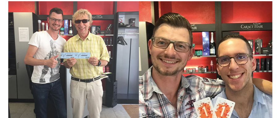
Grands gagnants chez Caract'Hair des places de cinéma et du concert pique-nique.

Une bonne occasion pour les commerçants d'être plus proches de sa clientèle. C'est pourquoi l'ACFL organise à certaines occasions des jeux par tirage au sort chez les commerçants participants. L'année dernière, lors des fêtes de fin d'année, les heureux gagnants se sont vu attribuer de généreux paniers garnis ainsi qu'un nombre limité de vélos et trottinettes électriques. Le prochain grand jeu se déroulera à l'occasion des fêtes de fin d'année. N'hésitez pas à vous rendre chez vos commerçants participants et tentez votre chance.