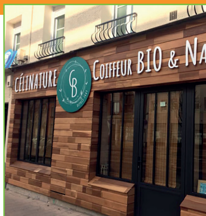
Célinature - 136, avenue de Laon