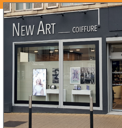
New Art Coiffure - 51, avenue de Laon