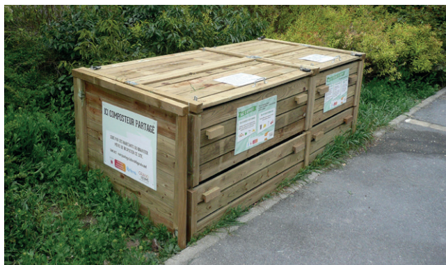
Nouveaux composteurs place Luton et rue Roger Salengro. Voir page 7.