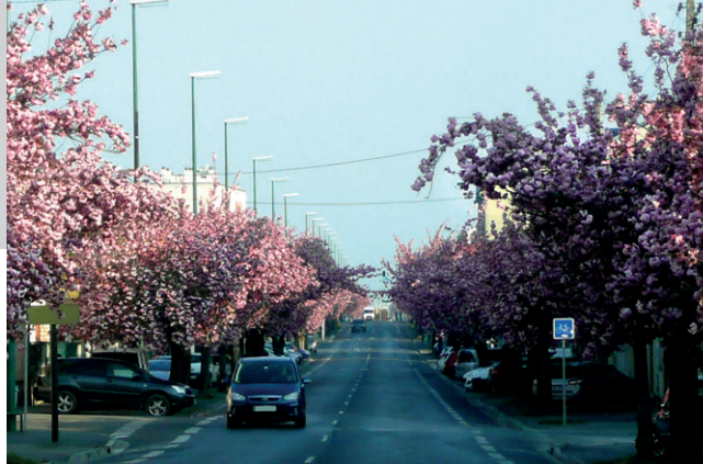
3 semaines par an, découvrez l'avenue de Laon en fleurs