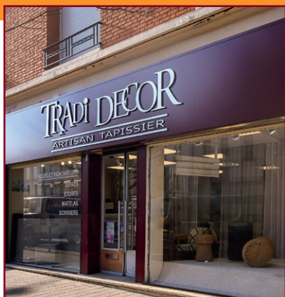
Tradi Décor - 141, avenue de Laon